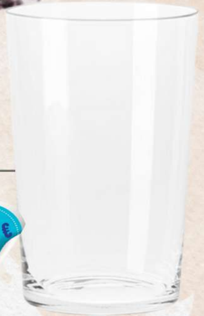
VASO EXTRAFINO 25 CL