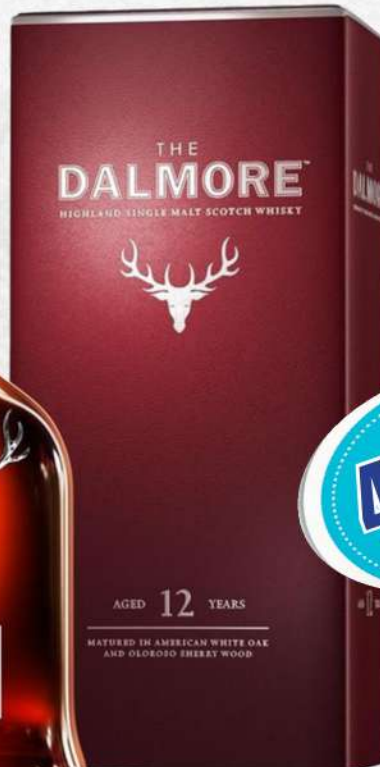
Dalmore 12 años WHISKY 70 CL