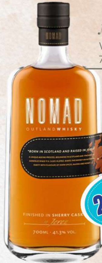
Nomad WHISKY 70 CL