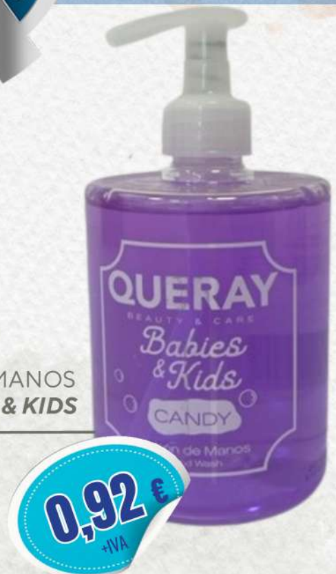
JABÓN DE MANOS BABIES & KIDS