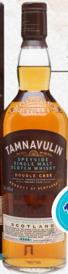
Tamnavulin DOUBLE CASK 70 CL