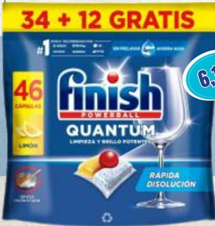
PASTILLAS LAVAVAJILLAS 34 UNIDADES