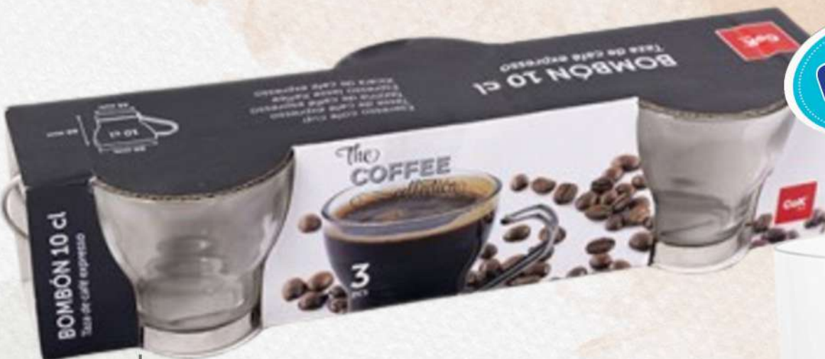
TAZA BOMBON ASA 10 CL