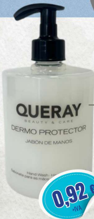
JABÓN DE MANOS DERMO PROTECT